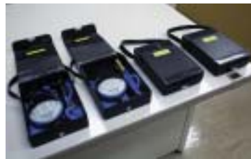
先生方は最初の授業前に講師控え室でマイクを受け取り、その日の授業が全て終わるまで同じマイクを使用

マイクからの赤外線信号は教室天井に設置された受光センサーWX-LZ100で受光。水平360°受光できるドーム型センサーで教室内の受信のムラを減らします。特に音途切れの出やすかった黒板を向いて使用した場合もしっかり受信、板書しながらの使用も難なくおこなえます。