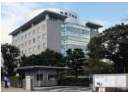
横浜キャンパス1号館。大学の本部の入るシンボリックな建物

赤外線ワイヤレスマイクシステムは、赤外線を使って信号を伝達します。光の一種である赤外線は壁を透過せず、同じ校舎の近接した教室で同時に使用しても混信しません。そのため、全ての教室を同じチャンネルに設定でき、講師控え室で受け取ったマイクはどの教室で授業をおこなってもそのまま使用することができます。