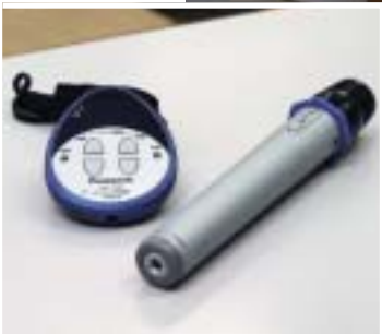
通常の授業で使用するペンダント型ワイヤレスマイクロホンWX-LT300(左)と予備のハンド型WX-LT100(右)