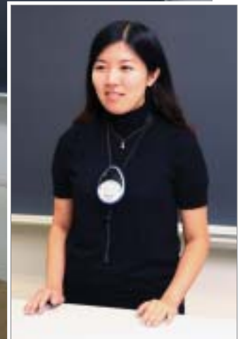
タイピン型では取り付けにくい服装でも、ペンダント型なら首に掛けるだけ

学校法人神奈川大学様は学生・院生合わせて約1800人が在籍し、横浜と湘南ひらつかにキャンパスを構えています。2007年8月、両キャンパス合わせて37教室に赤外線ワイヤレスマイクシステムが導入され、授業に集中できる環境作りをサポートしています。