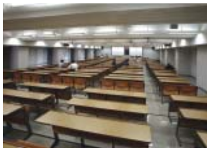
横浜キャンパス23号館にある400人弱の学生が入る大教室。23号館には、この他に様々な教室が並び、赤外線ワイヤレスマイクシステムが活躍している。