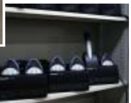
充電台WX-LZ100はマイク2台を同時に充電可能。省エネ設計によりハイパワーモードで約6時間の連続使用ができる