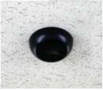
教室天井部に取り付けられた受光センサーWX-LS100。様々な方向から受光できるのがドーム型のメリット